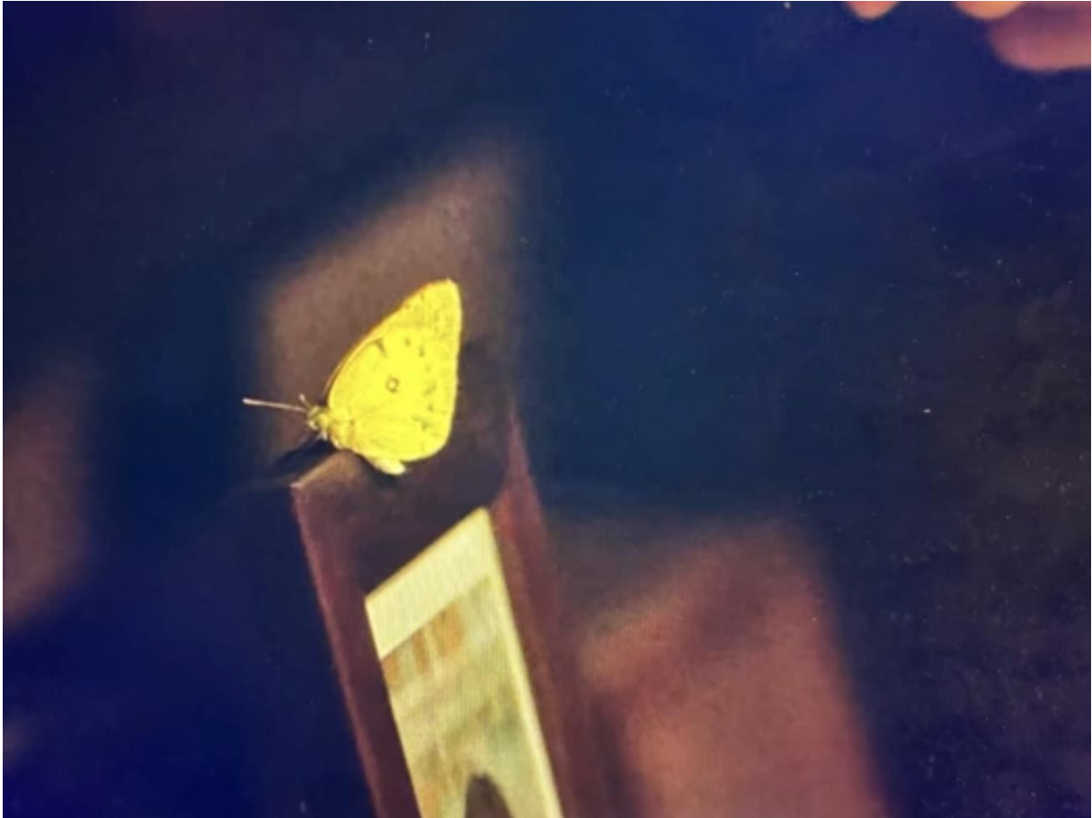
Still walking de hirokazu kore eda