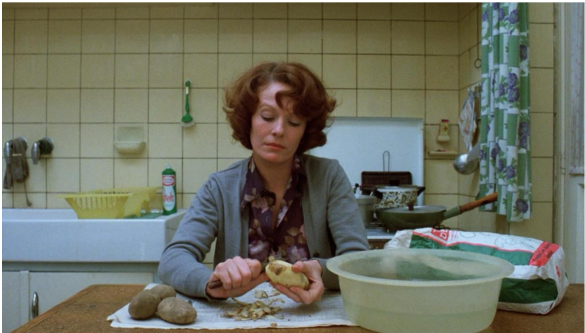
Jeanne Dielman 23 qui de commerce 1080 Bruxelles de Chantal Akerman