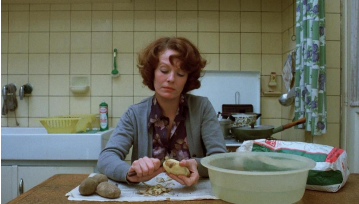
Jeanne Dielman 23 qui de commerce 1080 Bruxelles de Chantal Akerman