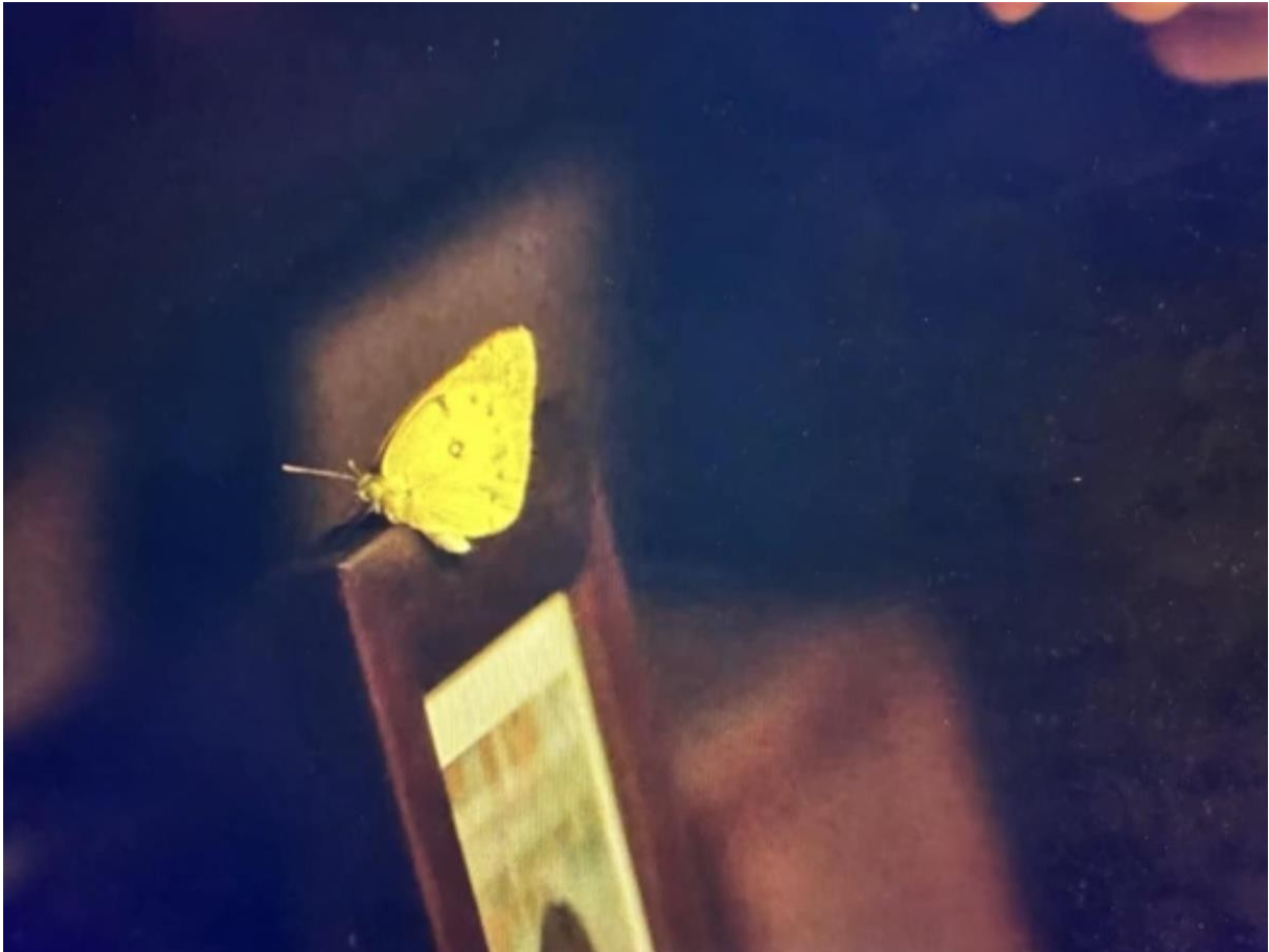
Still walking de hirokazu kore eda